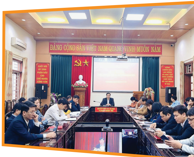
Điểm cầu Hồ Chí Minh

Cypresscom áp dụng công nghệ mới trong lĩnh vực tổ chức hội nghị và họp trực tuyến nhằm cung cấp giải pháp cho các công ty, tổ chức hoặc cơ quan chính phủ có thể tham dự hội nghị từ xa thông qua Internet và tham gia trao đổi, tranh luận trực tiếp với nhau một cách đơn giản và tiện lợi.