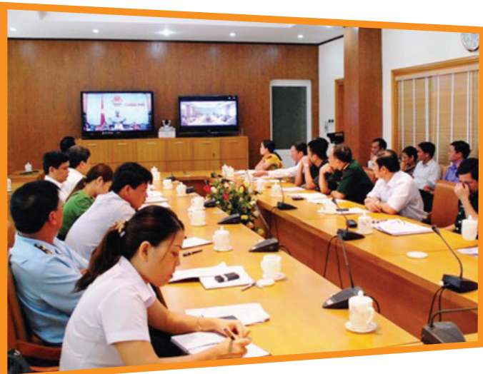
Điểm cầu Hà Nội